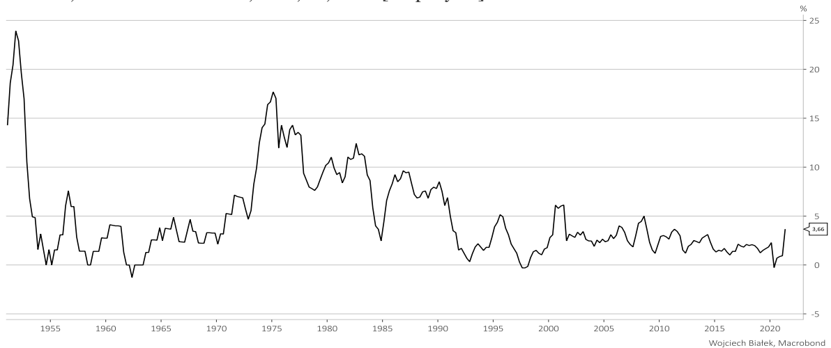
Australia, Consumer Price Index, Total, SA, Index [c.o.p. 1 year]

... roczną dynamikę sprzedaży detalicznej w Szwecji w czerwcu: