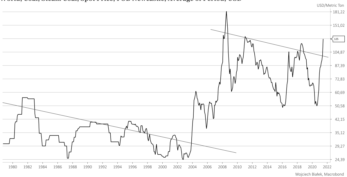
World, Coal, Steam Coal, Spot Price, FOB Newcastle, Average of Period, USD

Ten wzrost do najwyższego poziomu od 13 lat może się kojarzyć z podobnym ruchem z lat 2002-2004 (poniżej dane miesięczne do czerwca br.):