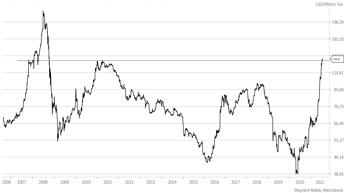
Coal, Future, ICE Rotterdam Coal, 1st Position, Close, USD

Ten wzrost do najwyższego poziomu od 13 lat może się kojarzyć z podobnym ruchem z lat 2002-2004 (poniżej dane miesięczne do czerwca br.):