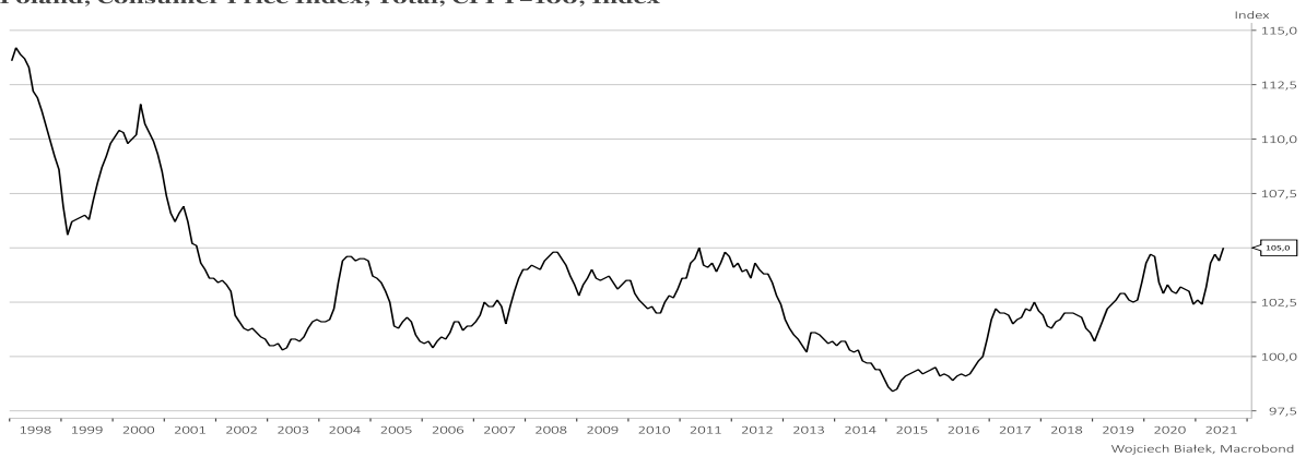
Poland, Consumer Price Index, Total, CPPY=100, Index

... oraz wyniki handlu zagranicznego Polski w maju: