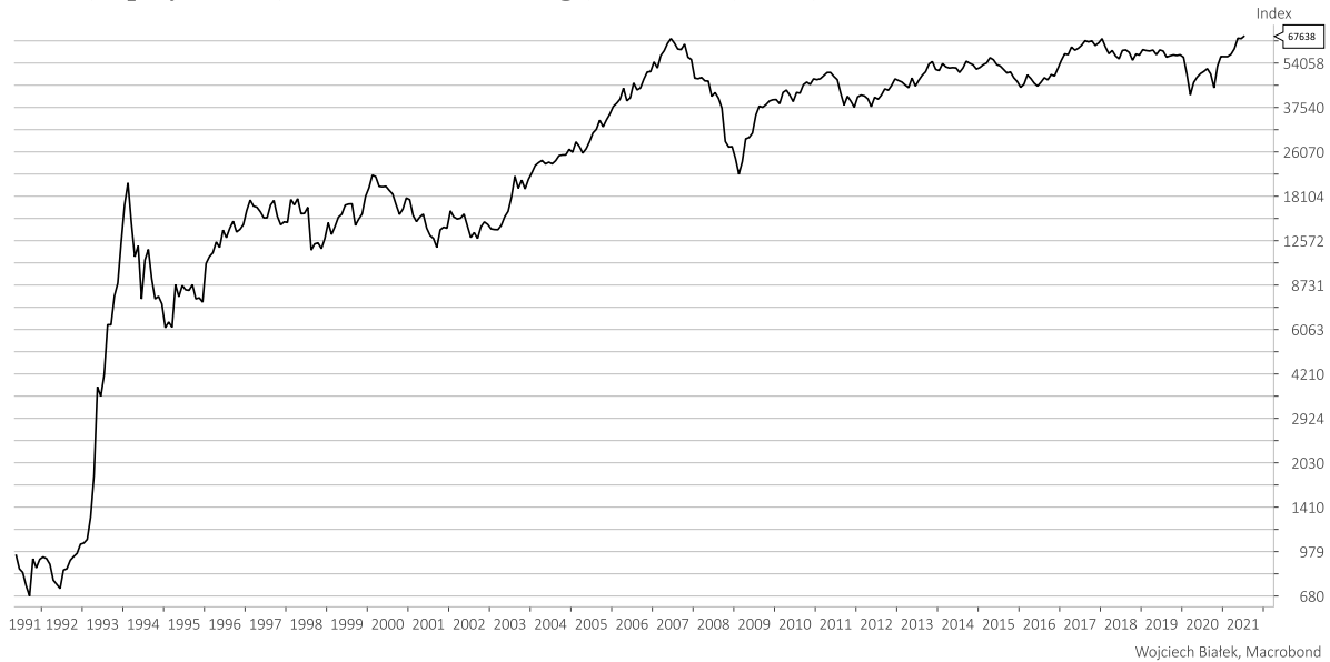
Poland, Equity Indices, Warsaw Stock Exchange, WIG Index, Close, PLN

Wśród polskich indeksów największy wzrost zanotował w lipcu WIG-Telekomunikacja (+13,8 proc.), zaś największe spadki WIG-LEKI (-8,1 proc.) oraz NCIndex (-5,6 proc.).