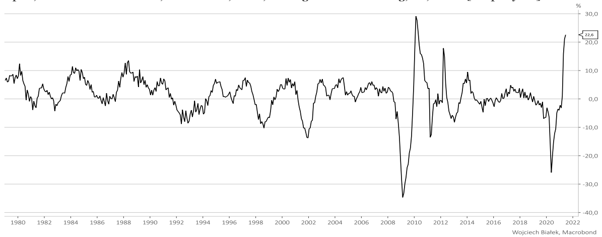
Japan, Industrial Production, Production, Total, Mining & Manufacturing, SA, Index [c.o.p. 1 year]

... +5 proc. roczną dynamikę CPI w Polsce w lipcu: