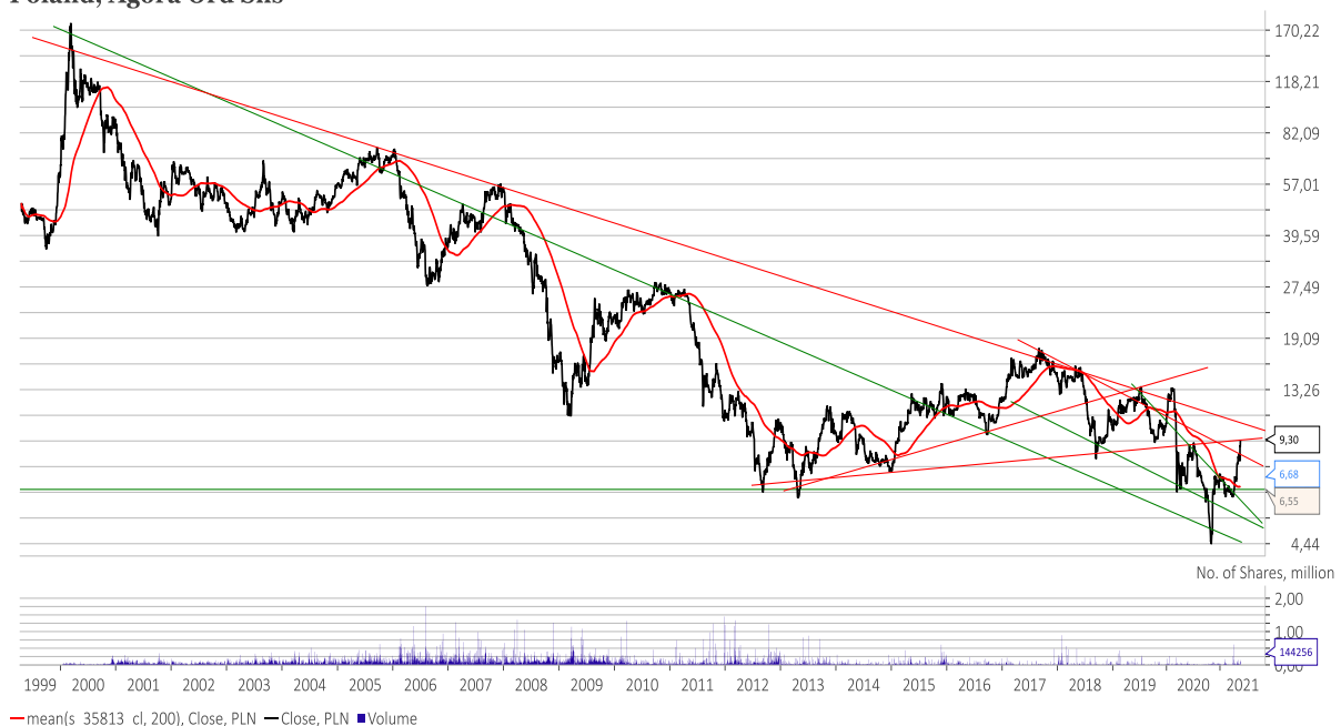
Poland, Agora Ord Shs

Akcje spółki Agora (C/WK 0,57, kapitalizacja 433 mln zł) zostały w tym miejscu wspomniane 31 marca ub. r. Tego dnia kurs akcji spółki zamknął się na poziomie 7,20 zł. Wczoraj jedna akcja spółki kosztowała na zamknięcie 9,30. Osiągnięcie przez kurs akcji spółki górnego ograniczenia kanału trwającego od 2017 roku średnioterminowego trendu spadkowego czyni przesłanki stojące za zwróceniem uwagi na akcje tej spółki 14 miesięcy temu nieaktualnymi.