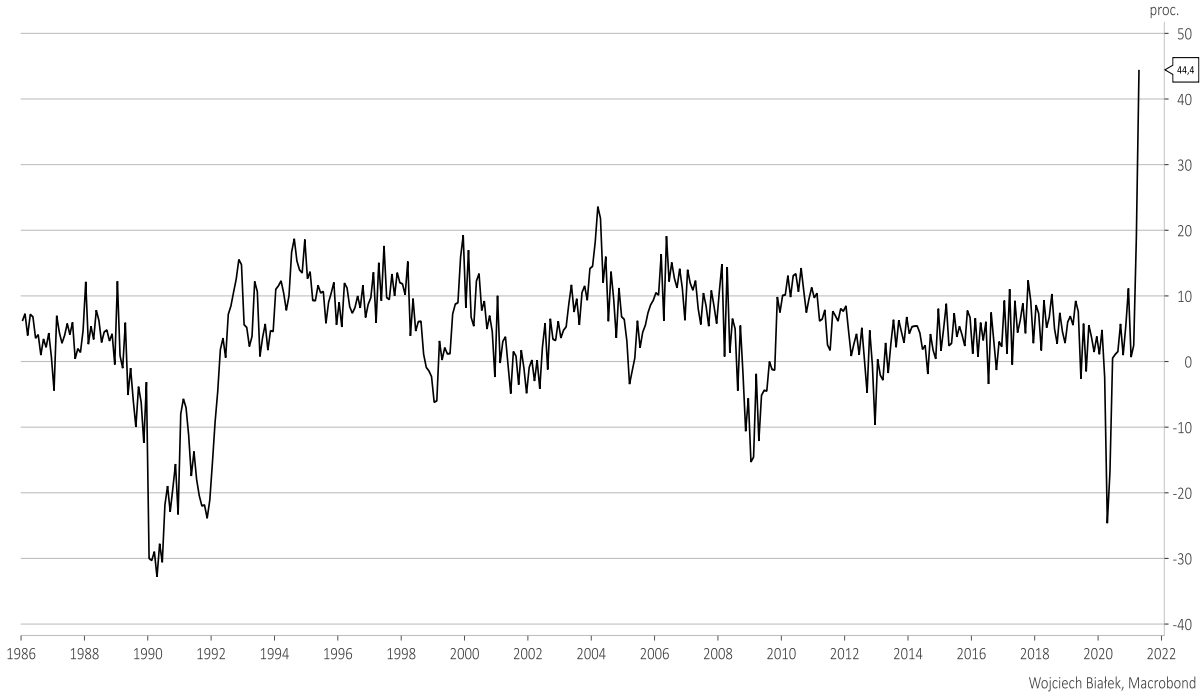
produkcja przemysłowa, zmiana roczna (%)

... oraz rocznej dynamiki produkcji budowlano-montażowej (-4,2 proc.):