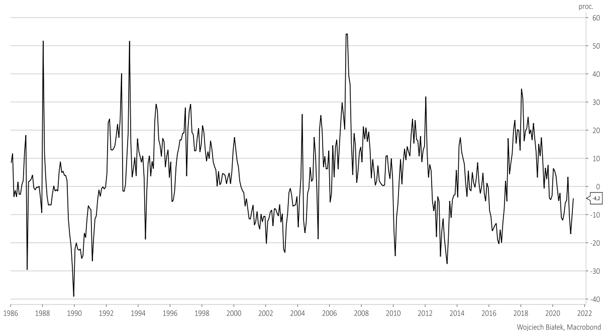
produkcja budowlano-montażowa, zmiana roczna (%)

... oraz rocznej dynamiki produkcji budowlano-montażowej (-4,2 proc.):