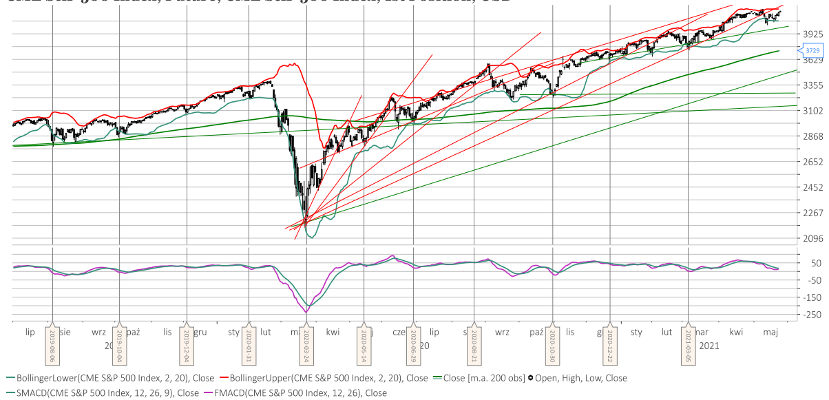
CME S&P 500 Index, Future, CME S&P 500 Index, 1st Position, USD

nowozelandzki NZX50 (-0,9 proc.). Najsilniej - o +2,4 proc. - rósł dziś Shanghai Composite Index.